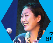
こむろゆい (シンガーソングライター)

1943年東京生まれ。1968年 グループ「六文銭」を結成。'71年第2回世界歌謡祭にて「出発の歌」(上條恒彦+六文銭)でグランプリを獲得。'75年 泉谷しげる・井上陽水・吉田拓郎と「フォーライフレコード」を設立。現在はライブ活動を中心に、テレビドラマ・映画などの音楽制作、ドキュメンタリー作品のナレーション、連絡コラムの執筆などその活動は多岐にわたる。最新の音楽担当作品は、「沖繩 うりずんの雨」(ジャン・ユンカーマン監督/2015年)、「戦場ぬしみ」(三上智恵監督/2015年)最新アルバムは「プロテストソング2」(2017年9月/FLCL-4509) オフィシャルサイト http://office-khys.com