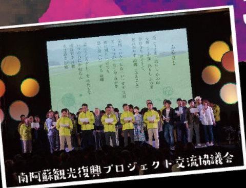
南阿蘇観光復興プロジェクト交流協議会